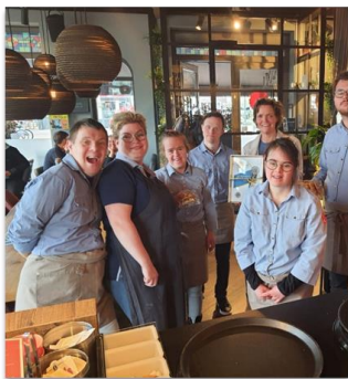
Een blijk van waardering voor de medewerkers van restaurant Allerlei.